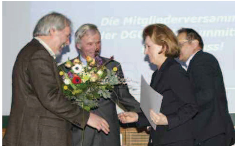
Abb. 3: Blumen zum Schluss