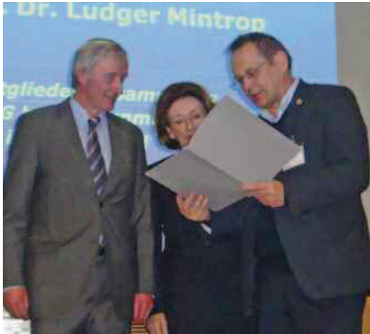
Abb. 2: Die Mintrop-Enkel und der DGG-Präsident